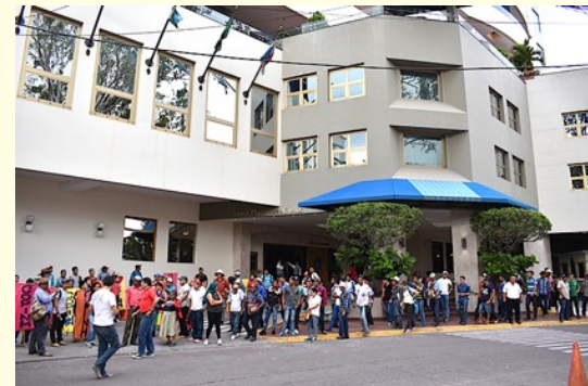
Organizaciones sociales protestan contra el tercer Congreso Minero en Honduras. Desarrollado del 25 al 28

un prestigioso hotel de la capital hondureña a puerta cerrada. "Un grupo de manifestantes se hicieron presentes para protestar contra este encuentro de empresarios mineros extranjeros", así denunció Bertha Isabel Cáceres, hija de la activista asesinada en 2016, Bertha Cáceres.