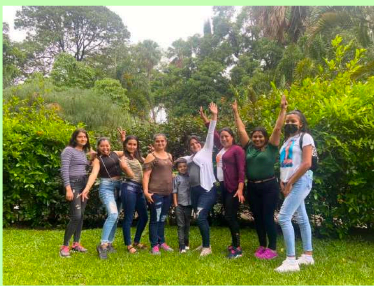
1 de junio - Las mujeres que son miembros de los Talentos Humanos de Radio Victoria realizaron un viaje al Jardín Botánico de San Salvador como parte de el Programa de Auto Cuido de las Mujeres

9 de junio - Dos miembros del Talento Humano participaron en el segundo taller virtual de Gerencia y Mercadeo.